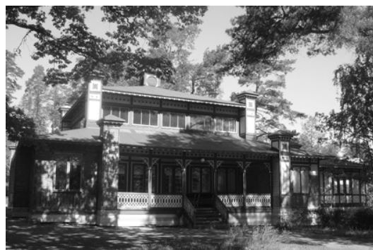
Officersmässen på Laxön

Sportfiskemuseet har flyttat från Officersmässen till f.d. Laxforskningsinstitutets byggnad. Älvkarlebygruppen föreslår att Officersmässen ska få behålla en utåtriktad verksamhet kring natur, kultur och fiske med anknytning till bygden. Under Älvkarlebyveckan är Officers-mässen öppen varje dag klockan 14.00 med varierade programpunkter som annonseras separat på staffli vid Bifrostbron.