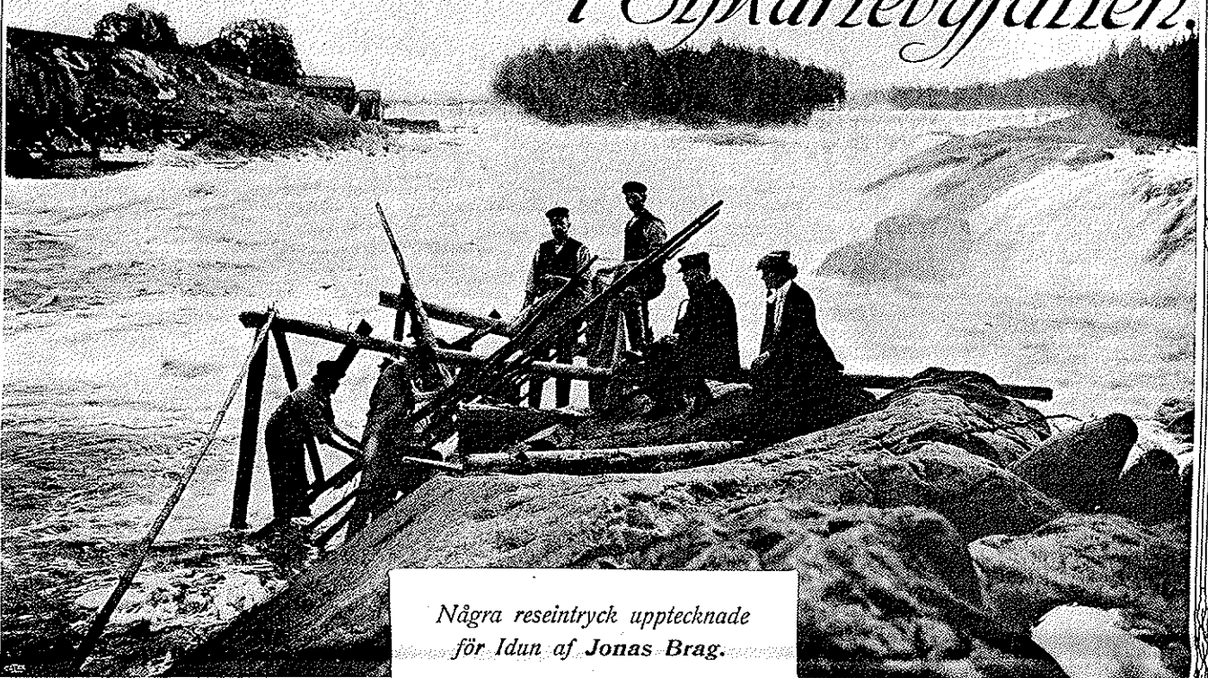
Några reseintryck upptecknade för Idun af Jonas Brag.

SJUMANNALAGET REDO TILL TINORNAS UPPTAGANDE.