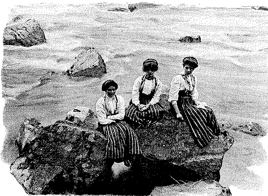
TRE JÄNTOR PÅ EN STEN I ÄLFKARLEBYFALLET.

— Här ska' jag ha den äran att bjuda på riktigt fina nejonögon! Se laxfisket är slut för i år, men nejonögonfisket har högsåsong just nu, och det är egentligen mycket märkvärdigare, eftersom