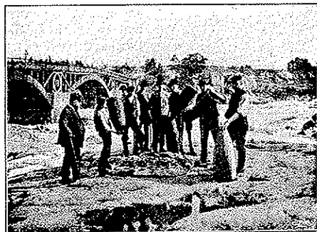
Fångsten delas. Till vänster Kari XIII:s bro.

Dänet från fallen, ja, det är den röda tråd, som genomspinner allt häruppe. Det hör man, när man sig nedlägger och uppstår, vid arbetet, vid måltiden, vid hvilat — utan återvändo; det är ett aldrig sinande, evigt brusande ackompanjemang till lifvet i helg och söcken vid Älfkarleby.